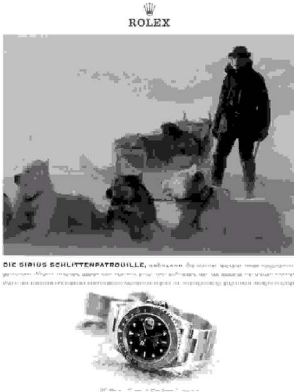
Abbildung 9, aus: Die Bühne, 5/2001, S. 2.

Er ist stets auf sich gestellt, muss Entscheidungen alleine treffen und trägt die Verantwortung für sich und seine Umgebung, sei es das Wohl der Firma, der Untergebenen, der Familie oder, wie in diesem Beispiel, das Überleben der