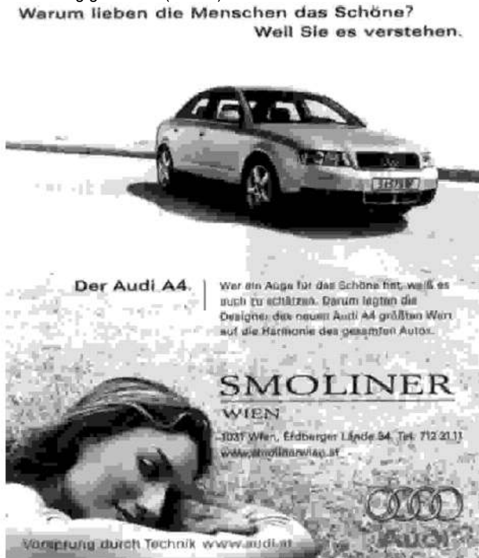
Abbildung 4, aus: Die Bühne , 11/2001, s. 83.

Das Auto als beliebtestes Spielzeug des Mannes muss allemal so schön sein wie eine attraktive Frau. Und weil jeder Mann ein ‚Auge für das Schöne‘ hat, weiß er es ‚auch zu schätzen‘. Das Schöne soll man(n), geht es nach der Audi-Werbung, jedoch auch verstehen. Und weil ja bekannt ist, dass die Frau dem Mann ein unbekanntes Wesen ist, deshalb steht ihm das Auto dann letztlich doch näher als die Frau. Er wird sich also im Zweifelsfall gegen die Frau oder zumindest gegen die Argumente seiner Frau beim Autokauf entscheiden und das Modell seiner Wahl erwerben – dazu wird er jedenfalls von diesem Werbesujet aufgefordert.